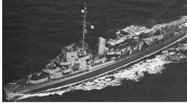
USS Eldridge (DE 173) 1944

Gökkuşığı Projesi (Rainbow Project) adıyla da bilinen bu deney, 1984 yılında beyaz perdeye aktarılan kadar ciddiye alınmamıştı. Ancak o tarihten bu güne kadar resmi makamlarca defalarca yalanlanmasına rağmen en çok merak edilen konulardan biri olmuştur.